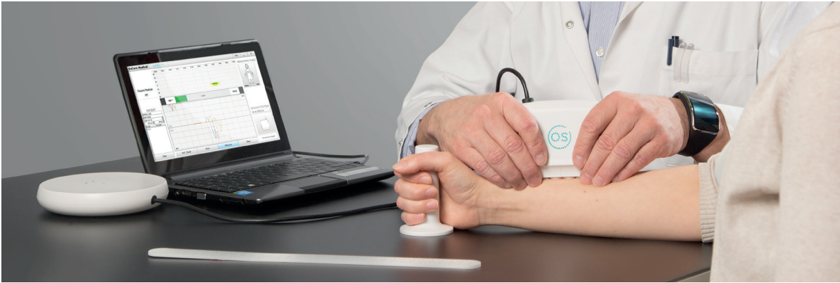
OsCare Sono® -luunlujuusmittaus on vaivatonta ja tulos on välittömästi luettavissa tietokoneen näytöltä.